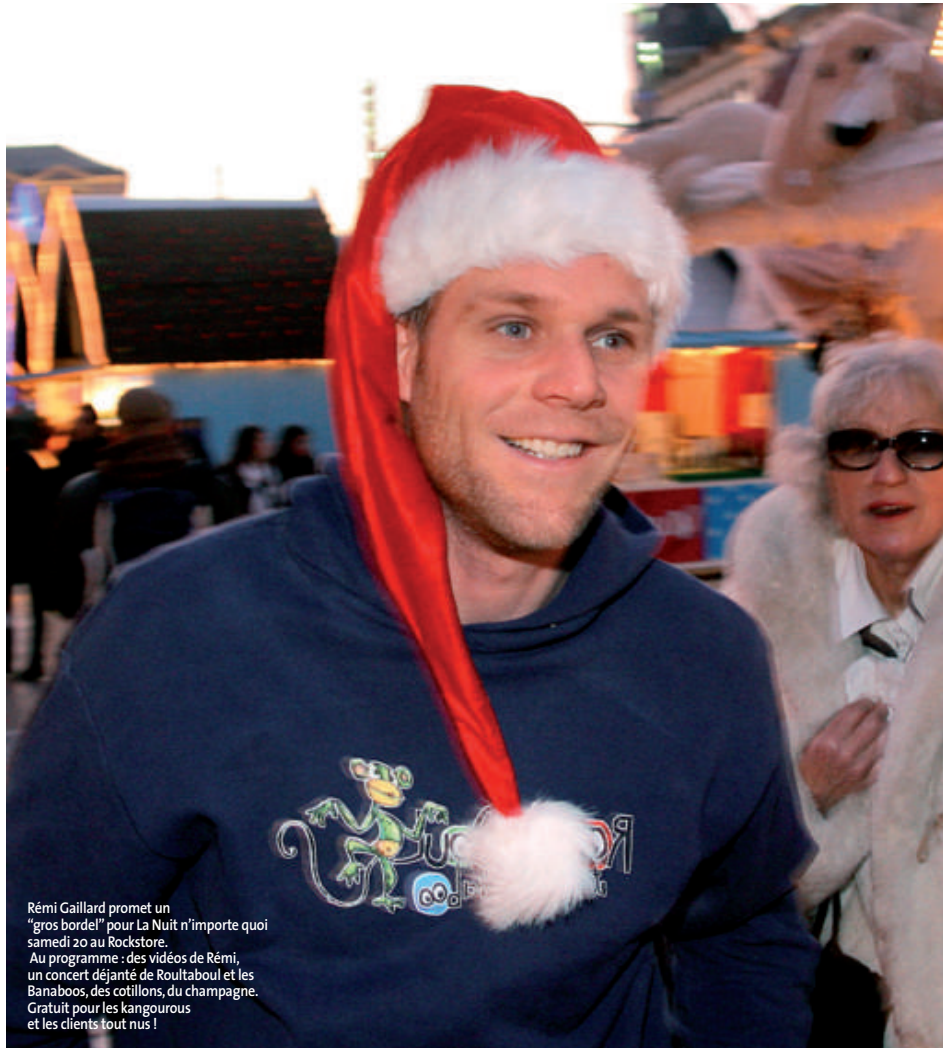
Rémi Gaillard promet un "gros bordel" pour La Nuit n'importe quoi samedi 20 au Rockstore. Au programme : des vidéos de Rémi, un concert déjanté de Roultaboul et les Banaboos, des cotillons, du champagne. Gratuit pour les kangourous et les clients tout nus !

Certes, sa production n'est pas toujours très fine (son sketch avec l'animateur Cauet, par exemple, où Rémi sort la vaseline au moment de signer un contrat léonin...). Certes, c'est